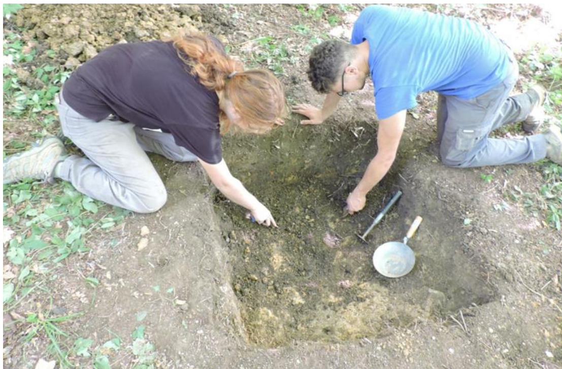
Istraživanje probne sonde na lokalitetu Zaluka – Kurija

U središnjem dijelu brežuljka smještenog unutar oštrog zavoja kojeg čini rijeka Kupa, nalaze se ostaci novovjekovne kurije Zaluka. U 18. stoljeću pripadala je plemićkoj obitelji Zebić, no kasnijih podataka o njoj nemamo. Danas je taj prostor prekriven šumom, a na mjestu gdje se nalazila kurija vidljive su ruševine dviju zgrada, glavne zgrade i vjerojatno gospodarskog objekta. Zidovi oba objekta prekrivena su urušenim kamenjem i zemljom, a oko njih se nalazi mali zaravljani plato. S ciljem da se dozna o mogućem postojanju nekog ranijeg fortifikacijskog objekta na ovom mjestu, poduzeta su probna iskopanja s dvije sonde. Sonda 1 dimenzija 1 x 2 m, otvorena je ispred nekadašnje glavne zgrade kuriji, u središnjem dijelu lokaliteta, dok je sonda 2 dimenzija 1 x 1 m otvorena na sjevernom dijelu platoa. Sonda 1 ima zanimljivu stratigrafiju i sastoji se od 11 stratigrafskih jedinica, a radi se o naizmjeničnim slojevima tamnosive i žute zemlje, debljine od samo 5 do 10 cm, kojima je bila zatrpana velika ispuna. Unatoč maloj površini istraživanja pronađeno je puno nalaza, čak 935 uglavnom ulomaka novovjekovne keramike, većinom svjetlijih tonova i tankih stijenki, a velik broj ulomaka je bio i oslikan geometrijskim motivima. Među nalazima se posebno ističu dvije koštane drške noža ili nekog drugog pribora za jelo. Općenito se iskopani materijal može pripisati novom vijeku, no za točniju dataciju biti će potrebno izvršiti detaljniji pregled materijala.