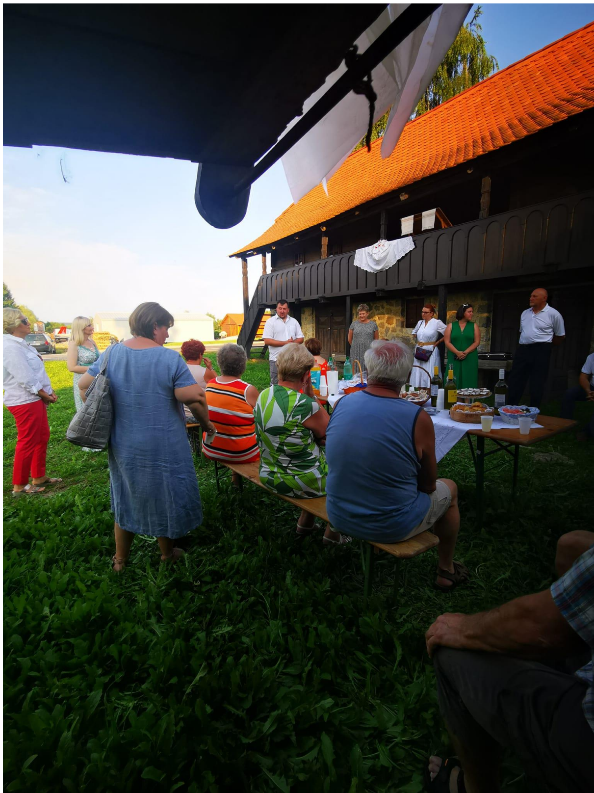
Korisnici: šira javnost